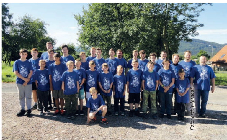
Via legenda 2018