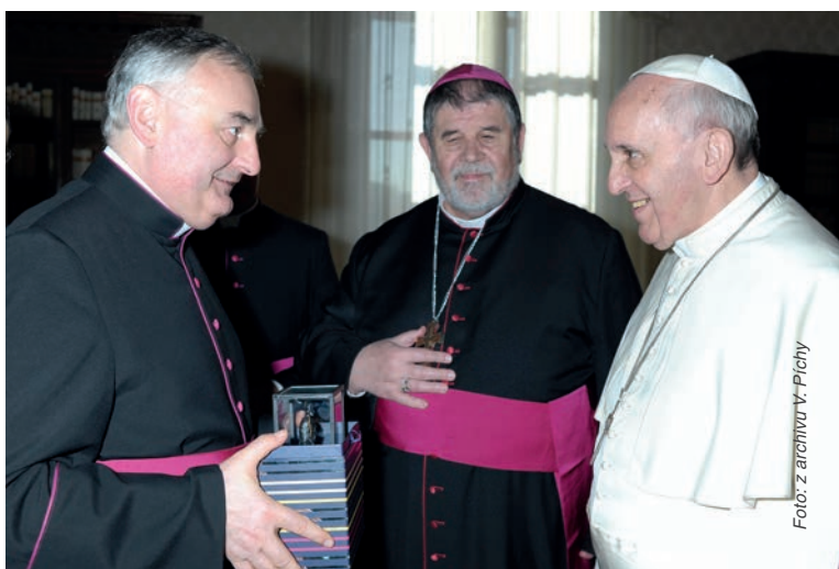
Audience u Svatého otce Františka, Vatikan 2014

Moji prarodiče a celá naše rodina patřili mezi tyto rumunské