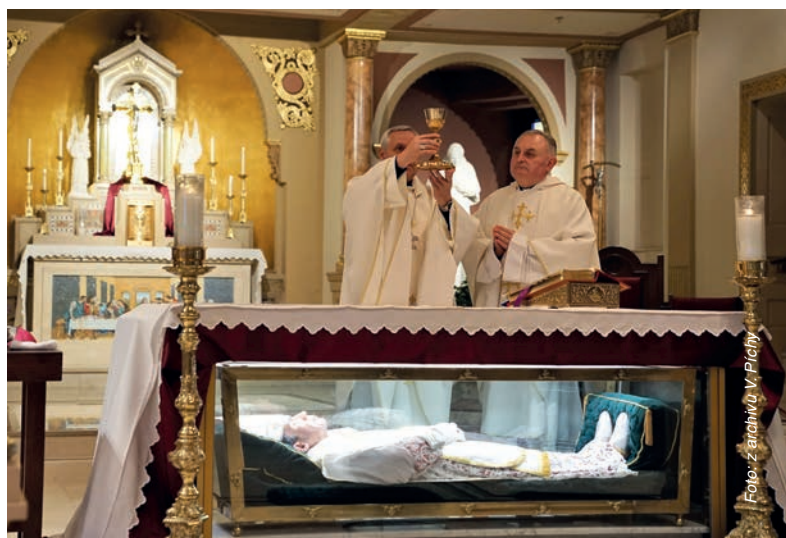
Mše svatá nad hrobem sv. Jana Nepomuka Neumanna ve Filadelfii, USA 2019

V kostele samozřejmě nepotkáváme pouze zahraniční poutníky. V současné době je bohužel návštěva bohoslužeb a kostelů v centru města ztížena nemožností sem přijet například autem, když zde není možné ani projet, ani zaparkovat. Průjezd historickým centrem i parkování v nejbližším okolí jsou totiž zpoplatněny, a to dost vysokou cenou. Na nedělní mši svatou v Českém Krumlově jste tak díky městským opatřením nuceni jít i několik set metrů, někdy i přes kilometr pěšky anebo si zajet autem někam jinam například do Zlaté Koruny, kde vystoupíte přímo u kostela. Často se tak s věřícími z Krumlova setkávám v mých okolních farnostech – v Kájově, Větrní, Věžovate Pláni či Přídolí. Nebo kolega farář ve Zlaté Koruně. Tento problém trápí především naše věřící v seniorském věku. Pro ně je velmi obtížné vůbec pěšky projít městem po krkolomných historických kostkách až do kostela. Totiž v Českém Krumlově v historické části města již skoro nikdo nebydlí – jsou zde totiž jen samé restaurace, hotely, obchody se zlatem a broušeným sklem – dá se říci, že vše je podřízeno