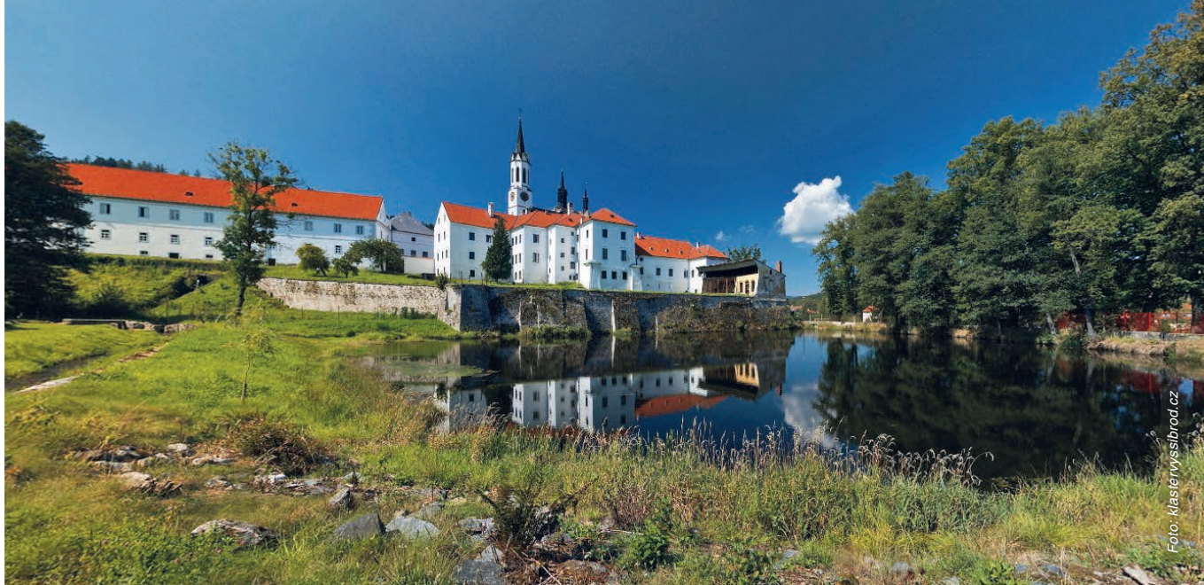
Vyšebrodský klášter od jihovýchodu