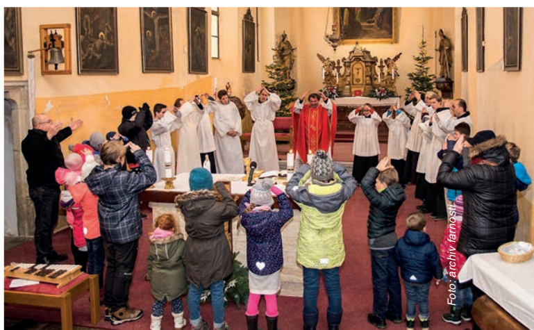
Dětská vánoční mše

Za dobu trvání ministrantských schůzek, táborů i bitev se současně posouvají i role jednotlivých účastníků těchto akcí. Z kdy si nejmladšího účastníka prvního ročníku tábora je už vedoucí - armiger, který připravuje program pro mladší kluky. Z vedoucích, kteří původně vymýšleli hry a běhali celý den s ostatními kluky, jsou nyní táborový kuchař, údržbář a zdravotník.