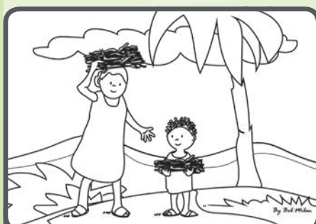
Jednoho dne jsem ji viděla, jak se vrací z pole s velkým svazkem dřeva na hlavě. Zeptala jsem se jí, jestli nechce pomoci. Po chvíli váhání mi dřevo podala.