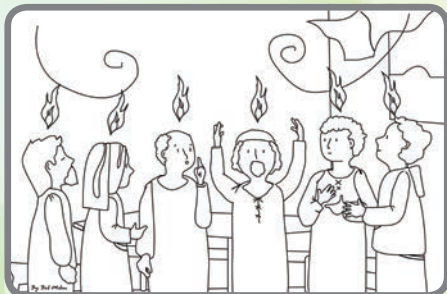
Jak Ježíš slíbil, seslal na apoštoly po svém vzkříšení ucha Svatého.

Obrázky si vybarvi a přemýšlej, jak bys podle toho mohl/a „žít“ i ty?