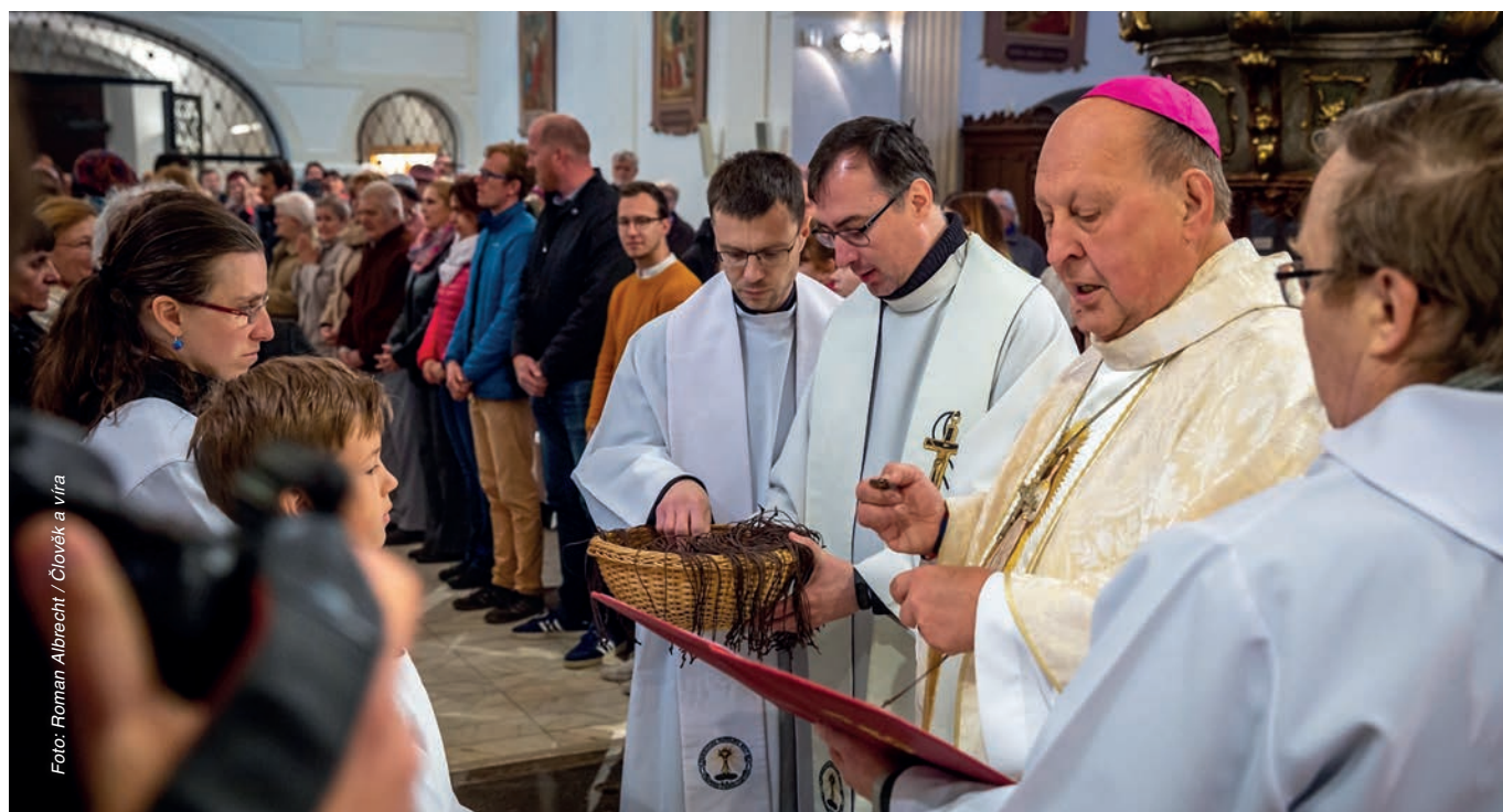
Zahájení Festivalu víry Klokoty 2019. Misionářům, kteří v Táboře v týdnu 11.–19. května zasévali v rámci Dnů víry, požehnal 12. května biskup Pavel Posád a celebroul mši svatou