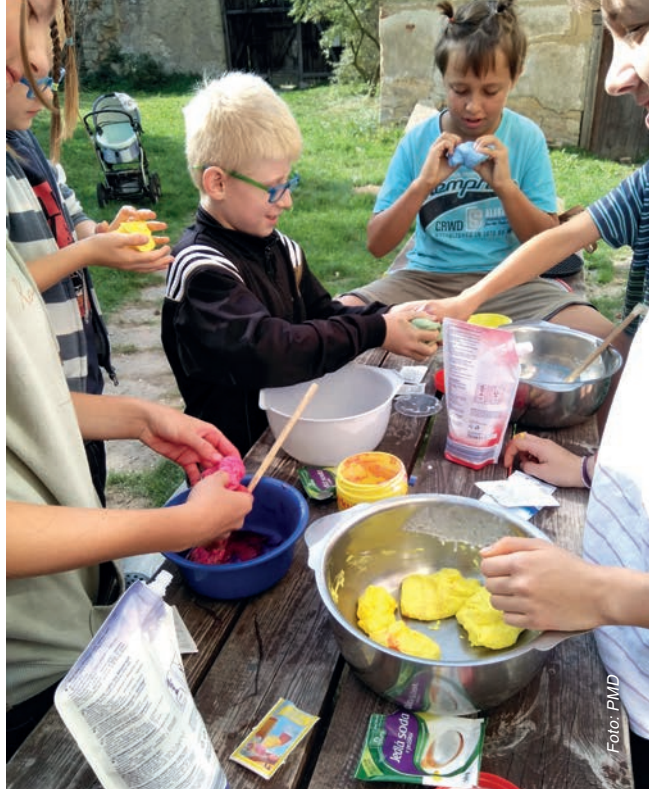
Nečtiny 2018 – vyrábění pro radost i misie

Hrubý nástin programu je takový, že dopoledne trávíme společně na faře od ranních chval v kapli přes dopolední duchovno, rozhovory ke mši svatě a obědu. Odpoledne vyrážíme buď společně, nebo jak kdo chce na výlety do blízkého či vzdáleného okolí. Večerní program určitě spojíme aspoň jednou s OMI mladými, kteří v tom týdnu ve vedlejším Manětíně pořádají setkání s prací pro druhé Workshop (a na večer mají pozvaného Vítu Marčíka, dětské dopoledne atd.). Stravujeme se společně - každý den vaří jedna rodina. Ubytování je romantické a mládežnické, nečekejte žádný luxus, ale o to větší zážitky. Jestli se nám podaří domluvit, účast-