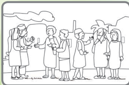
S pomocí Ducha Svatého vyprávěli apoštolové všem o Ježíši.