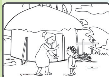
Měla jsem sílu donést jí dřevo až domů. Když jsme tam došli, řekla mi: „Bůh ti žehnej.“ Měla jsem velkou radost.

Pán Ježíš slibuje apoštolům, že dostanou od Boha sílu Ducha svatého, aby mohli být jeho svědky po celém světě a až na konec země. To samé očekává od každého z nás. Říká: „..... a .....“ (viz tajenka) Boží království.“