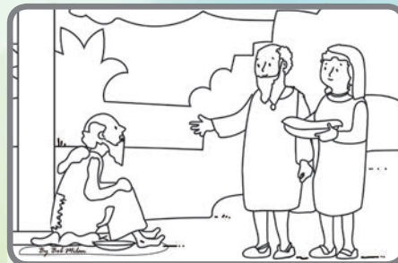
Lidé jim naslouchali a z jejich příkladu se učili, jak žít jako Ježíš.